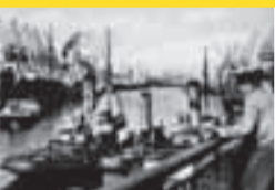
Historische Bilder, brandaktuelle Projekte und kühne Visionen