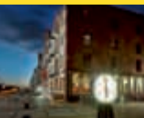
Infocenter Überseestadt im restaurierten Speicher XI

Neues im Frühling! Die nächste Sonderausstellung startet am 09. März 2010