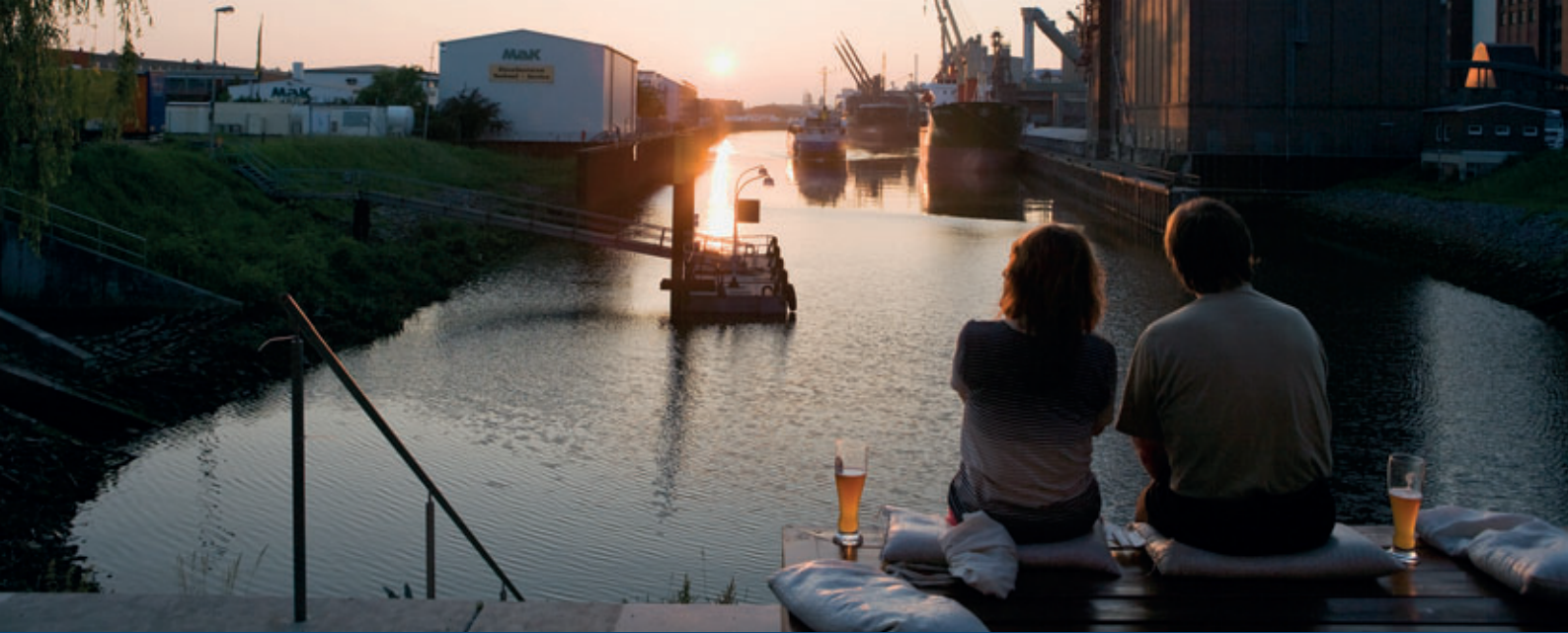
Abendstimmung am Holz- und Fabrikenhafen