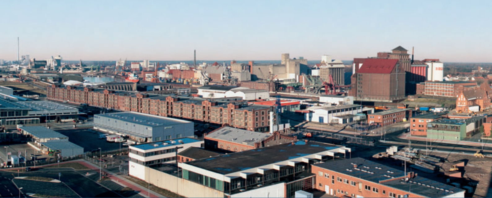
Blick auf den Holz- und Fabrikenhafen