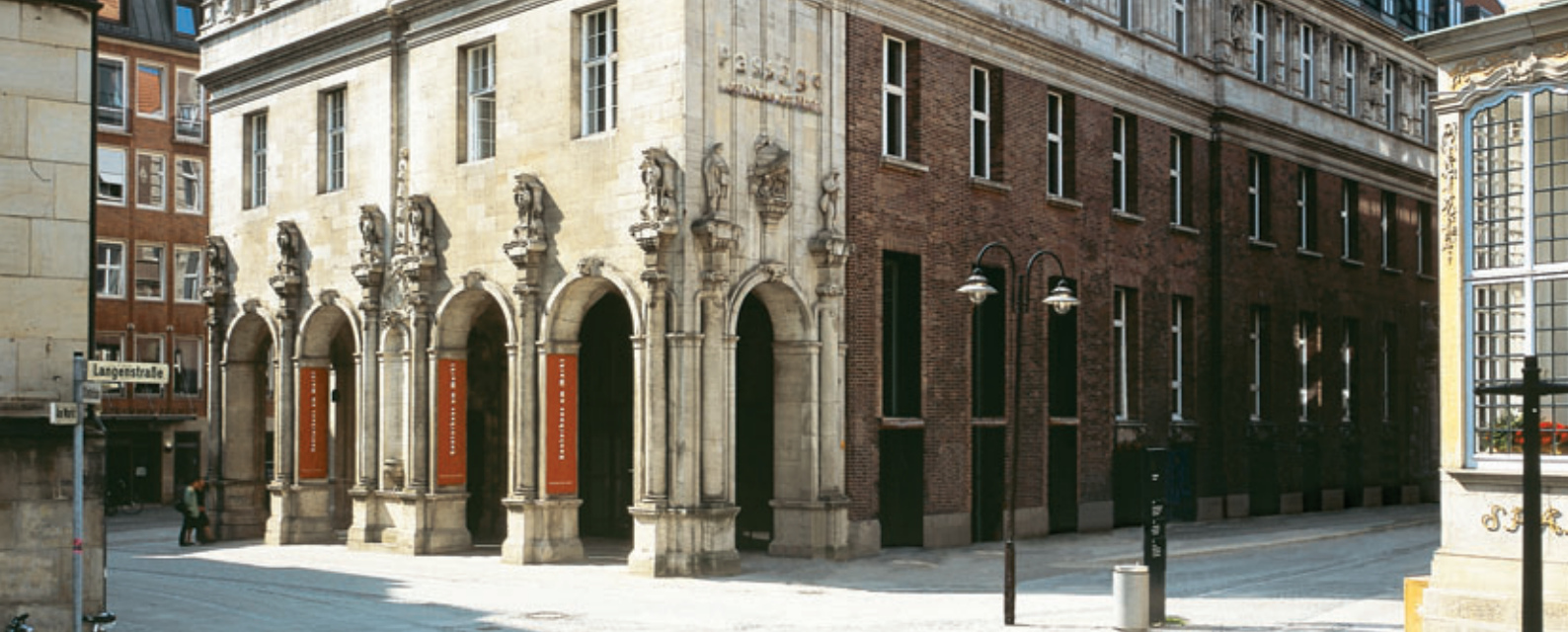
Kontorhaus in der Langenstraße 2–4: Sitz der WFB Wirtschaftsförderung Bremen