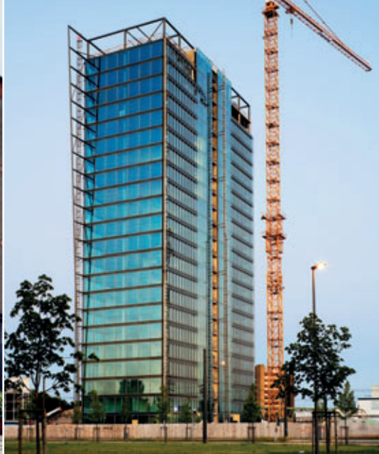
Promenade am Europahafen / Speicher XI / Weser Tower