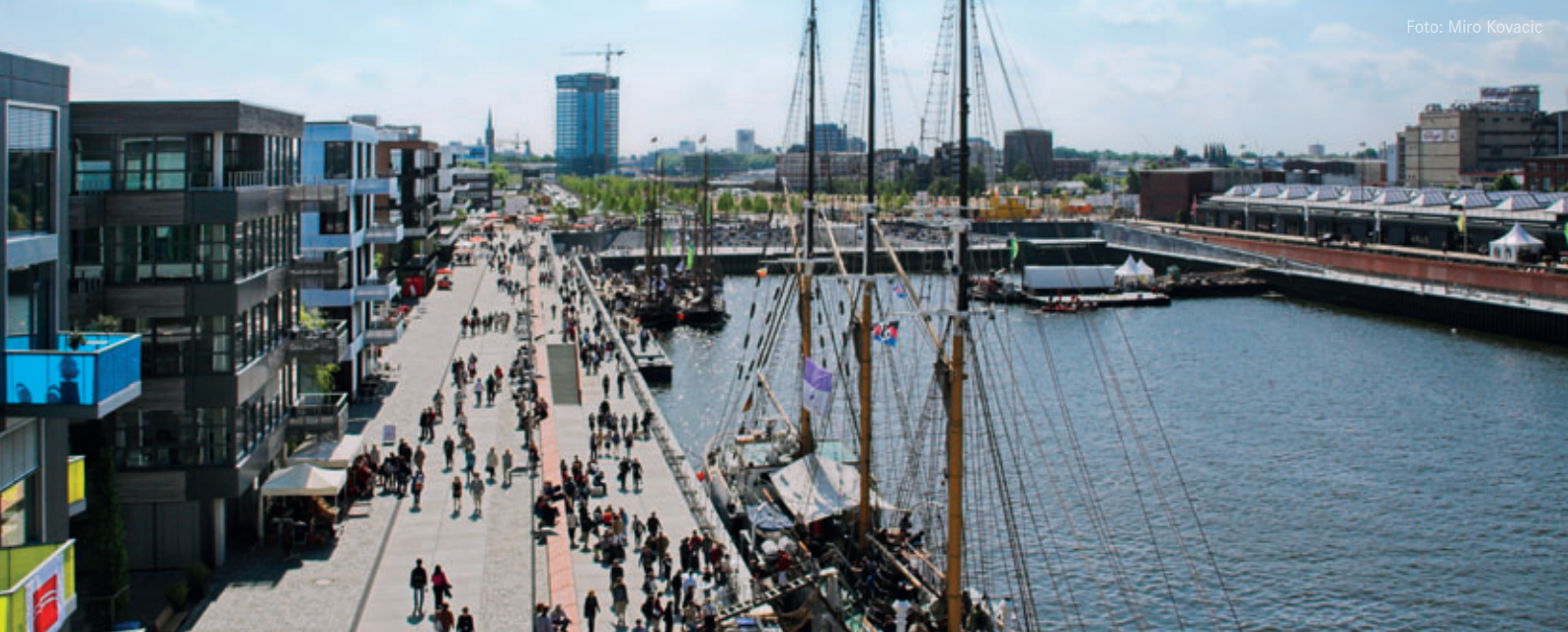
Blick auf den Europahafen