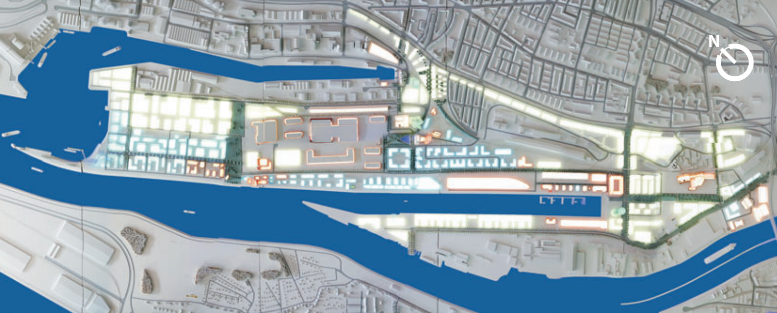
Modell der Überseestadt Bremen: 1,5 km bis zur Bremer City